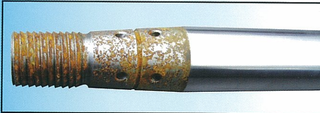
Tableau comparatif de test au Brouillard salin neutre (selon ISO 9227 NSS & ISO 10289)